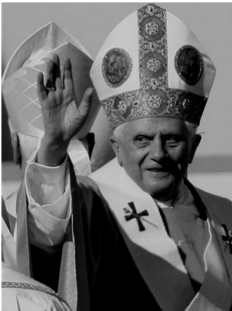
GIÁO HOÀNG BÊNEDICTÔ XVI

1. Khởi đầu một Năm Mới, Cha muốn gửi lời cầu chúc nồng nhiệt về hoà bình và hy vọng chân thành đến quý anh chị em khắp nơi trên thế giới. Cha cầu chúc như thế để cùng nhau chúng ta sẽ suy nghĩ về chủ đề mà Cha đã nêu lên ở đầu bức thông điệp này. Đó là điều mà Cha cho là có tầm quan trọng đặc biệt: Đại gia đình nhân loại, một cộng đồng hòa bình . Hình thức giao tiếp giữa con người được phát sinh từ tình yêu giữa một người nam và một người nữ, những người này đã quyết định bước vào một nôi kết vững chắc để cùng nhau tạo nên một gia đình mới . Không chỉ vậy, mọi người trên thế giới đều được mời gọi tạo nên những mối tương quan liên đới và cộng tác với nhau như là thành viên của một đại gia