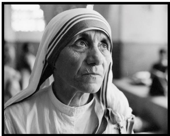
(Bilingual – Song ngữ) Tặng Thiếu nhi Thánh Thể Cộng đoàn

What Vietnamese Catholic Youth can learn from Mother Teresa?